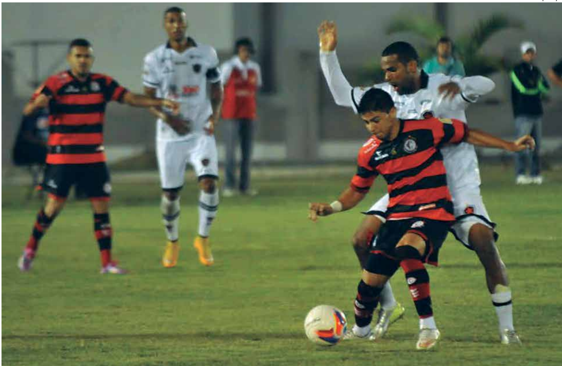
Lance de jogo realizado ano passado no Amigão quando as duas equipes empataram em 1 a 1, válido pelo quadrangular final do Campeonato Paraibano de 2015

No Botafogo, a vitória sobre o Sousa trouxe um novo