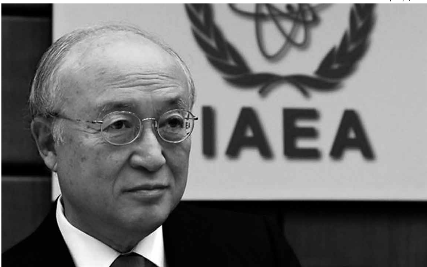
Diretor-geral da AIEA, Yukiya Amano, (foto), anunciou o encontro para os dias 22 e 23, em Brasília, para debater formas de combate

Até o momento, o vírus zika foi identificado em 23 países das Américas. Há, segundo a Organização Mundial da Saúde (OMS), fortes indicativos de que a infecção esteja associada ao aumento de casos de malformação congênita em bebês e da Síndrome de Guillain-Barré.