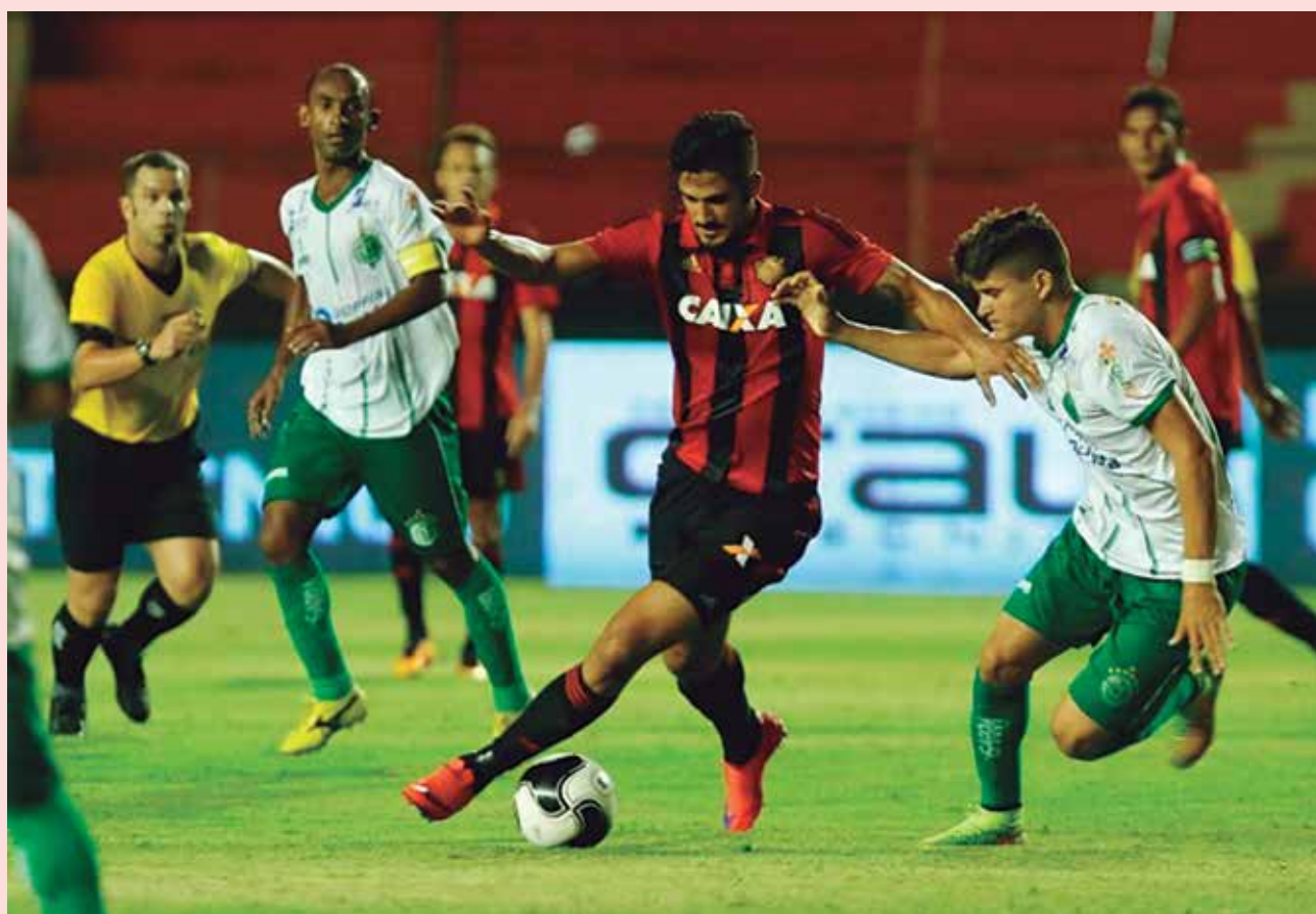
O Sport Recife será o adversário do Botafogo na estreia da Copa do Nordeste no próximo domingo no Almeidão

O email da CBF para o credenciamento é credenciamentocne@cbf.com.br. As solicitações deverão ter os seguintes dados: partida, estádio, veículo de comunicação, cidade e Estado do veículo, nome do profissional, documento de identidade, email para contato, associação de classe à qual pertence, e o número da credencial. (IM)