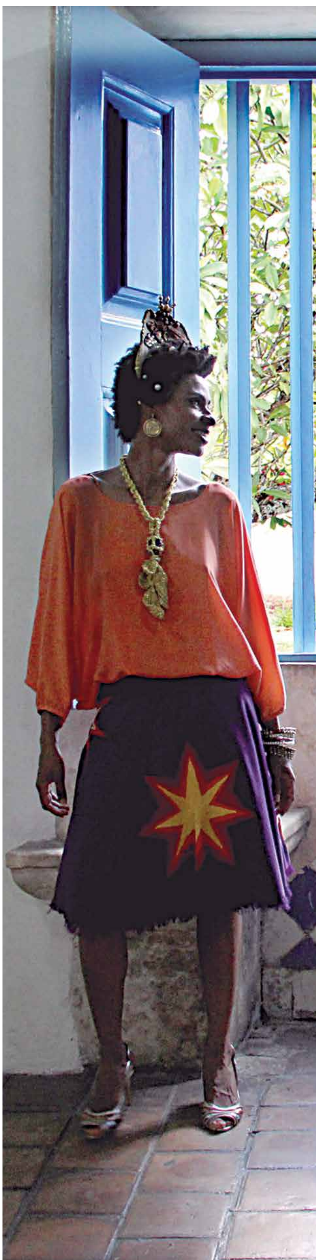
Cores remetem à energia de locais sacros