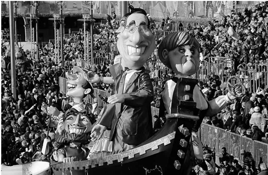
O Carnaval de Nice, na França, apresenta grandes bonecos que são uma atração à parte na festa

e em Campina Grande para o encontro da Nova Consciência.