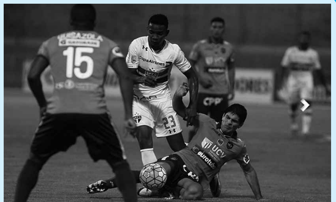
No jogo de ida, disputado no Peru, as duas equipes empataram em 1 a 1 e hoje decidem a vaga

Como empatou por 1 a 1 no primeiro jogo, o São Paulo se classifica se empatar por 0 a 0 ou se vencer por qualquer placar hoje no Pacaembu. O local foi modificado porque o Morumbi está vetado devido a troca de gramado.