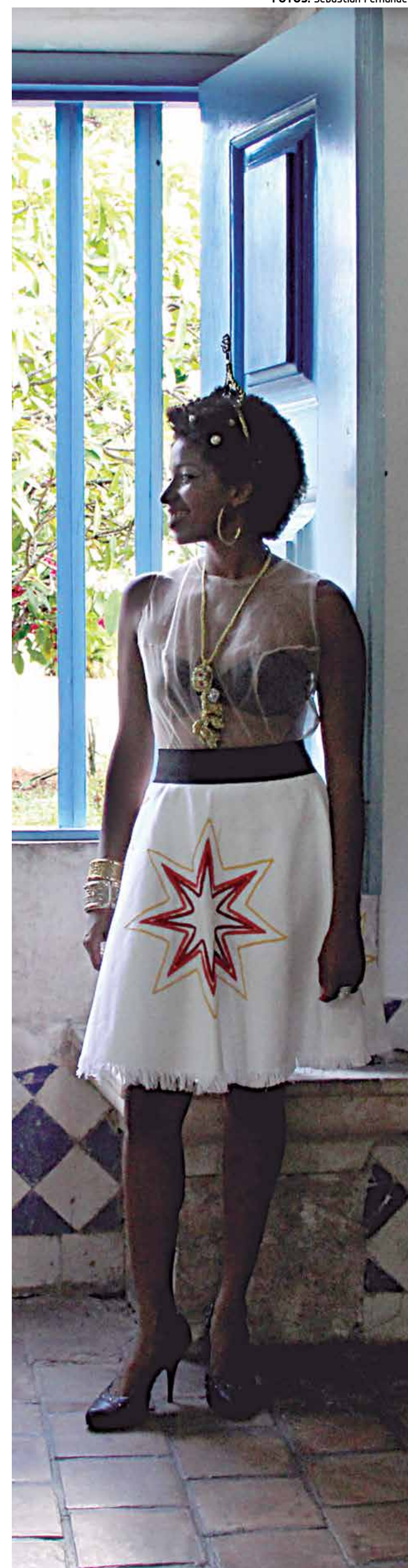
Peças são inspiradas no Espírito Santo