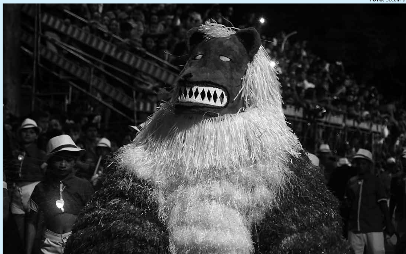
Dezoito agremiações da ala urso do Carnaval Tradição desfilou na última segunda-feira na Avenida Duarte da Silveira