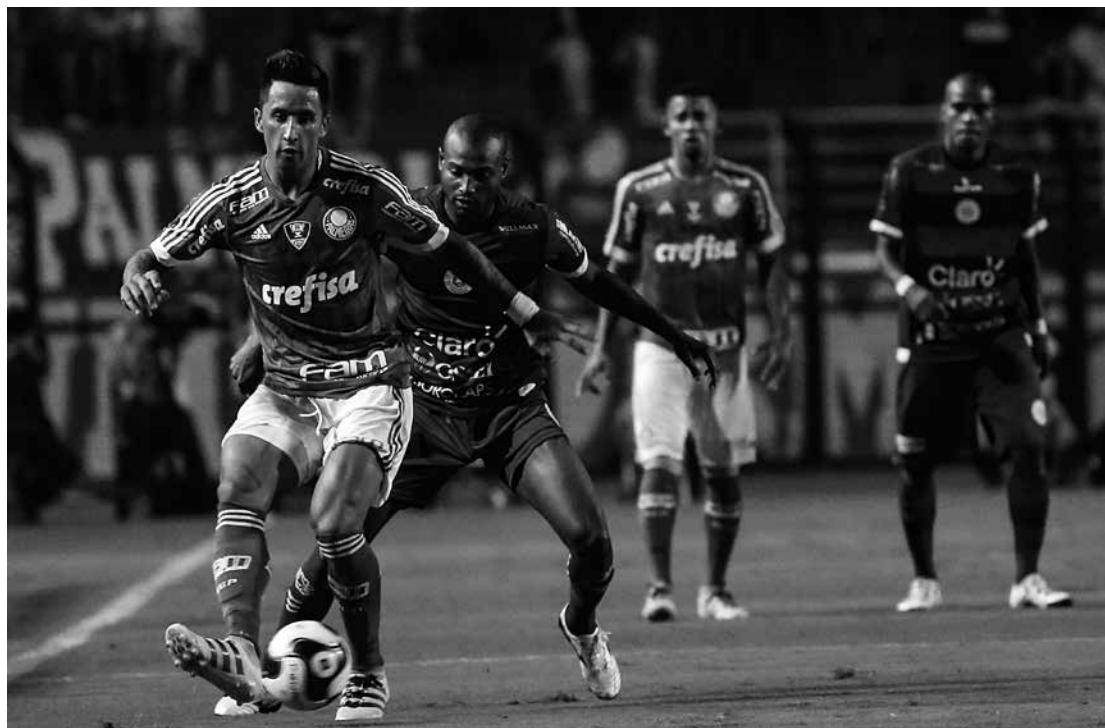
Alviverde vem de um tropeço após empatar em 2 a 2 contra o São Bento e hoje time entra modificado

Para o goleiro, este grupo tem condições de ser